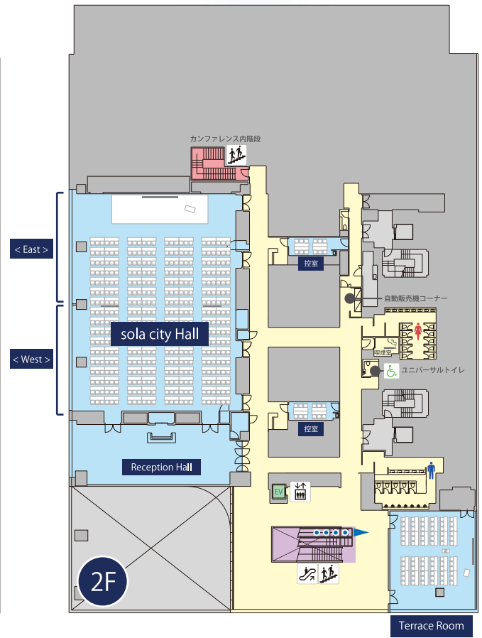
■ sola city Conference Center 会場料金表